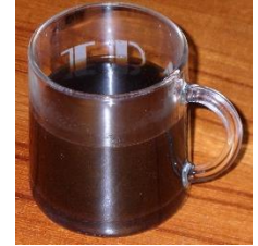
en kop kaffe