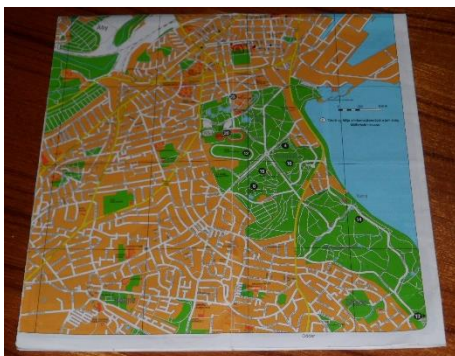
et kort (over København)